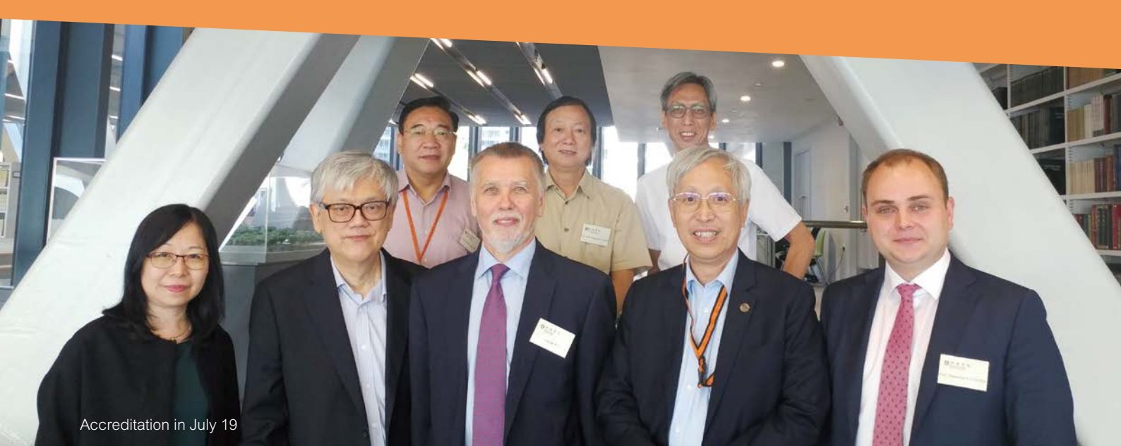
Accreditation in July 19